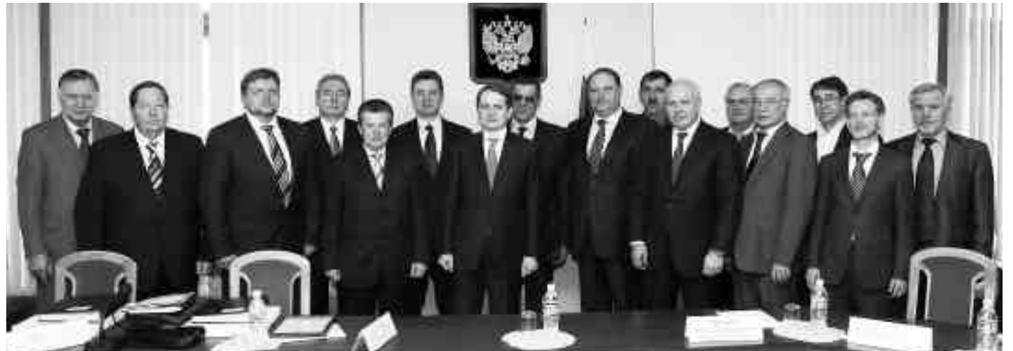
С 16 по 20 марта в Российской академии государственной службы при Президенте РФ проходил семинар для руководителей высших исполнительных органов государственной власти субъектов Российской Федерации.

В 2008 г. Академия заработала 1 млрд 25,3 млн руб. , что на 20,3% больше, чем в 2007 г.