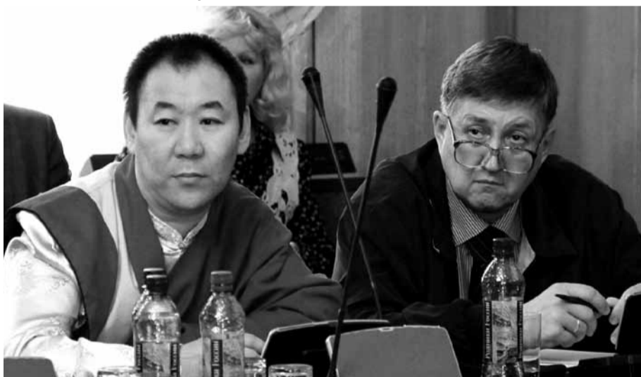
В конечном счете, основой всех человеческих ценностей служит нравственность.