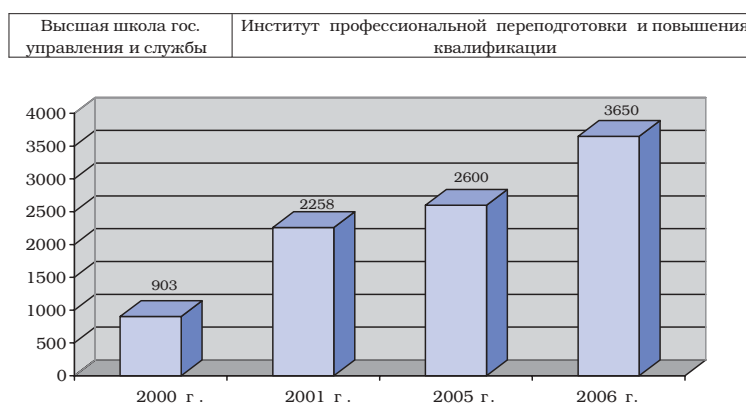
Динамика количественного состава слушателей ИППК за 2000 – 2006 годы