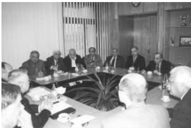
Делегация Пакистана в РАГС.

27 ноября 2006 года делегация пакистанского Колледжа по подготовке государственных служащих (г. Лахор) посетила РАГС и обсудила с руководством Академии вопросы организации двустороннего сотрудничества.