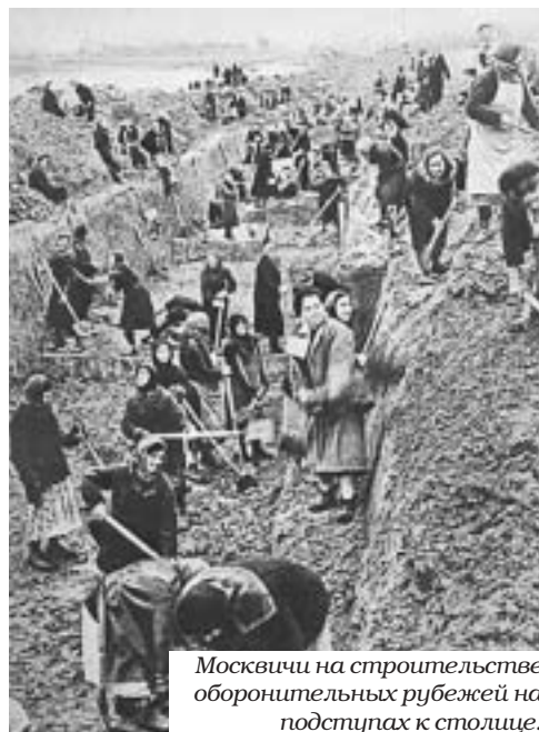
Москвичи на строительстве оборонительных рубежей на подступах к столице.

В нашей Академии накануне 60-летия победы в ВОВ был открыт мемориальный знак, посвященный защитникам Москвы.