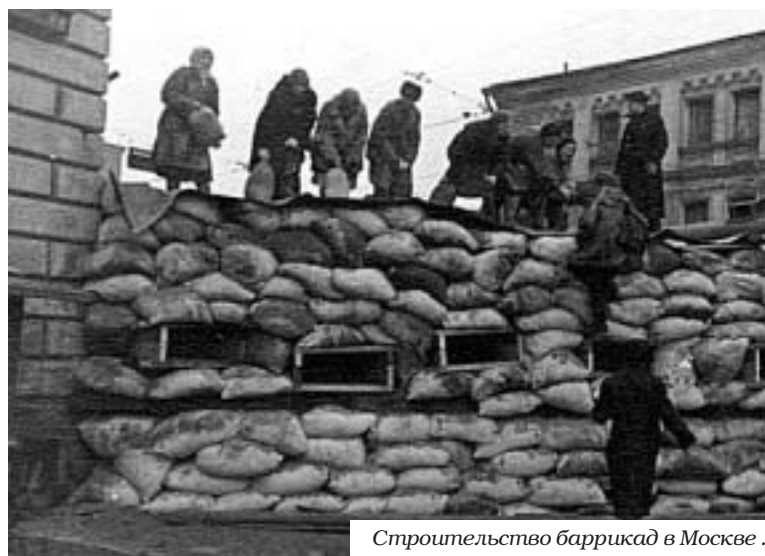
Строительство баррикад в Москве.