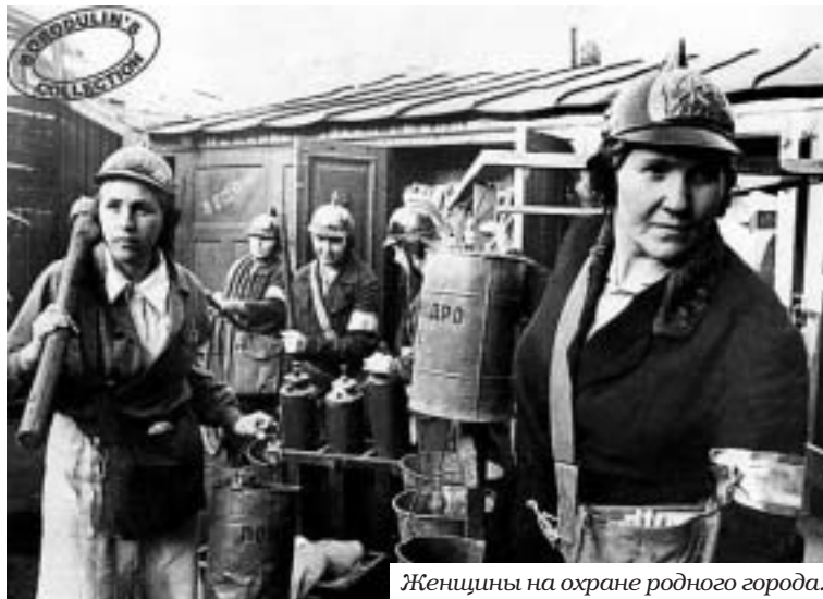
Женщины на охране родного города.