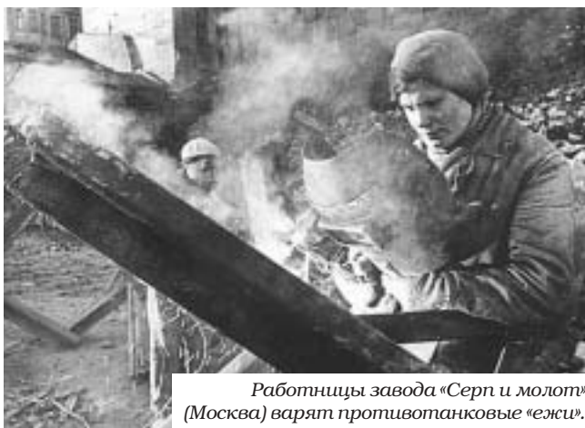
Работницы завода «Серп и молот» (Москва) варят противотанковые «ежи».