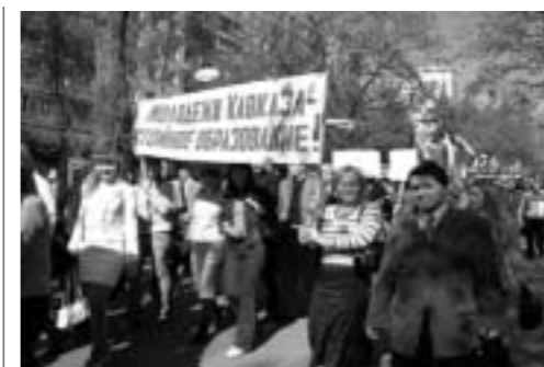
Торжественное шествие студентов по Ростову-на-Дону.

С 17 по 21 апреля с.г. в Ростове-на-Дону проходил международный студенческий фестиваль «Кавказ — наш общий дом», в котором принял участие 31 вуз Южного федерального округа из Ростова, Сочи, Невинномыска, Волгодонска, Пятигорска, Таганрога, Новочеркасска, Шахт, Ставрополя, Астрахани, Армени, Адыгеи, Абхазии, Карачаево-Черкесии, Кабардино-Балкарии, Калмыкии, Украины, Чечни, Осетии и даже Китая. Делегации вузов были представлены молодыми танзорами, вокалистами, артистами самодеятельных театров, участниками команд КВН, а также спортсменами студенческих сборных команд. Активными участниками фестиваля стали и студенты Северо-Кавказской академии государственной службы. В течение недели более