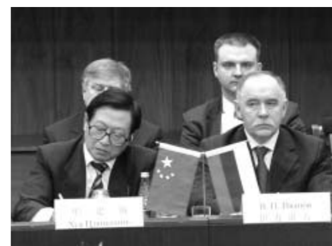
Хуа Цзяньминь — член Госсовета, Генеральный секретарь Госсовета КНР, В.П. Иванов — помощник Президента РФ.

Россию и Китай связывают отношения, которые на протяжении почти четырехсот лет сохраняли в основном дружественный характер, что нечисто-