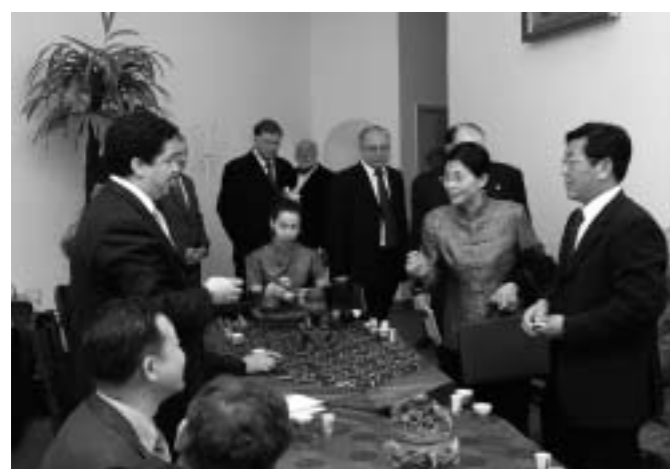
Китайская чайная церемония.

интерес, который участники проявили к осмыслению представленных докладов, констатируя положение дел в сфере двустороннего сотрудничества и предлагая дополнительные меры для его расширения. Участники конференции отметили, что отношения между двумя странами являются важным фактором геополитической стабильности, примером открытого международного партнерства, не направленного против третьих стран и нацеленного на формирование более совершенного и справедливого мирового порядка. Отмечался процесс углубления политического, торгового-экономического и