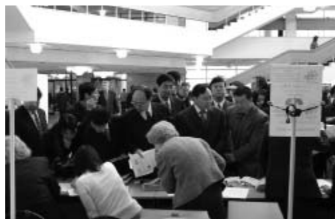
Регистрация представителей китайской делегации.

Как это ни покажется странным, Россия и Китай, при всей непохожести и разновозрастности цивилизаций, имеют немало общего в своем историческом развитии, в частности в обеих странах сохраняются устойчивые традиции сильной и часто эффективной государственной власти. Сегодня Россия и Китай показывают пример принципиально нового диалога между странами с различными культурами. Заметному расшире-