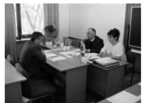
Идет экзамен по «Истории и философии науки».

17 мая с.г. аспиранты I курса очной формы обучения впервые сдавали кандидатский экзамен по новой дисциплине «История и философия