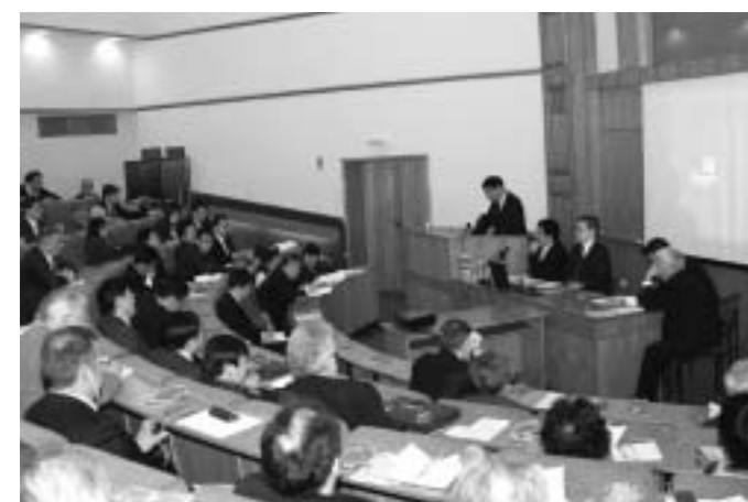
Секция «Торгово-экономическое и инвестиционное сотрудничество».

интерес, который участники проявили к осмыслению представленных докладов, констатируя положение дел в сфере двустороннего сотрудничества и предлагая дополнительные меры для его расширения. Участники конференции отметили, что отношения между двумя странами являются важным фактором геополитической стабильности, примером открытого международного партнерства, не направленного против третьих стран и нацеленного на формирование более совершенного и справедливого мирового порядка. Отмечался процесс углубления политического, торгового-экономического и