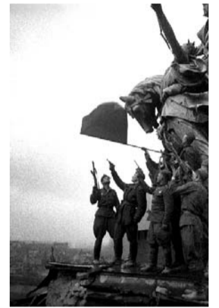
Берлин. Рейхстаг. 9 мая 1945г.