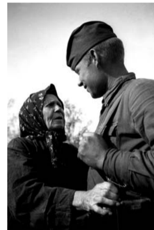
Солдат - освободитель.

Ранним утром танковая бригада и прикрывающая её 3-я батарея неожиданно ворвались на железнодорожную станцию Готовицзна, находившуюся далеко от линии фронта. Это было полной неожиданностью для немцев. На путях станции стояли несколько товарных и пассажирских поездов, а по перрону прогуливались дежурные офицеры. Наша колонна пересекла железнодорожный переезд, а фашисты не сразу обратили на неё внимание, приняв нас за своих. Лишь за переездом из окон близлежащих домов стали выглядывать сонные немцы и, увидев пятиконечные звёзды на башнях танков, начали выбегать из помещений, выпрыгивать из окон. Неожиданным было и появ-