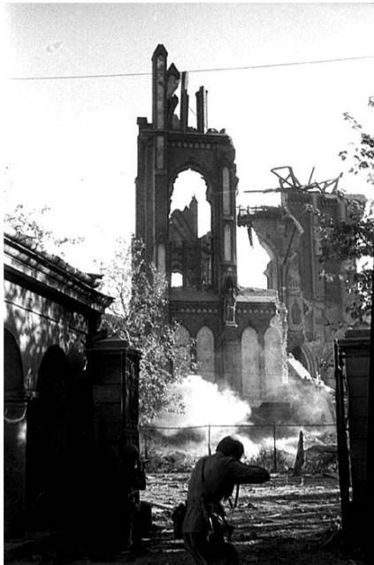
Бой в предместье Варшавы.