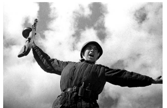
Вперед, за Родину!

В декабре 1944 г. я был откомандирован в 278-й отдельный ремонтно-восстановительный батальон автомобилей этого фронта на должность начальника