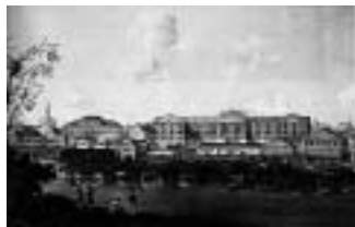
Вид на главный корпус университета.

15 июня 1757 г. с разрешения И.И.Шувалова новый директор Московского университета И.И.Мелиссино отправился в Петербург "для исправления некоторых самонужнейших университетских дел". В награду за успехи и прилежание он взял с собой для представления куратору и при дворе лучших студентов и учеников дворянской гимназии. 27 июля все эти юноши, заслужившие высочайшего внимания своими успехами, были представлены Шуваловым венценосной покровительнице университета императрице Елизавете Петровне на куртаге - дне, когда совершался выход при дворе. Государины жаловала их к руке, а некоторые удостоены были ее беседы.