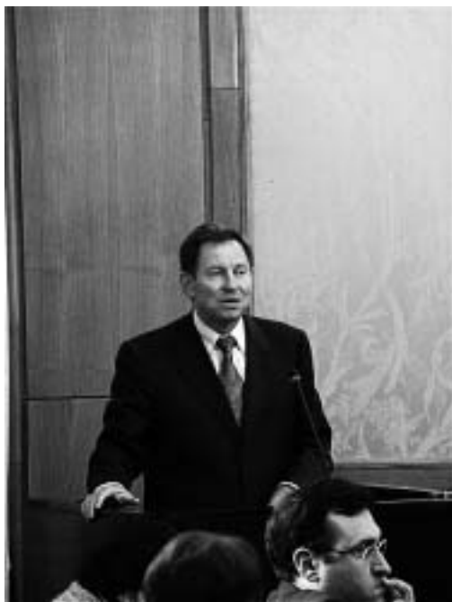
На трибуне В.А. Яковлев – министр регионального развития РФ.

19 октября с.г. состоялось очередное заседание Ученого совета. Основным вопросом повестки дня стало обсуждение опыта взаимодействия Академии и подведомственных ей образовательных учреждений в профессиональном обучении муниципальных служащих в условиях реформирования местного самоуправления.