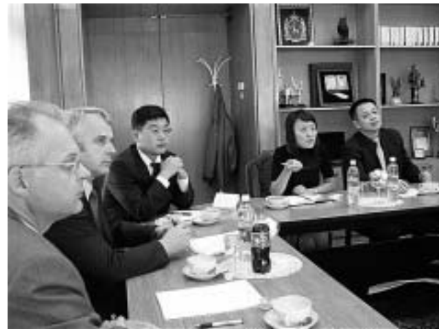
Встреча с госслужащими КНР.