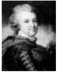
Князь Г.А. Потемкин-Таврический.