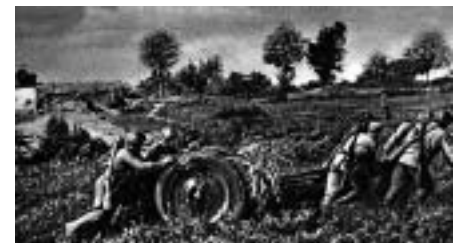
Переход на новую огневую позицию.