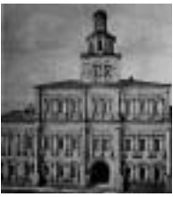
Главная аптека у Воскресенских ворот - первое здание Московского университета.

Согласно уставу университет был разделен на три факультета: юридический, медицинский и философский. Все предметы должны были излагаться по-латыни или по-русски. Обучение в университете начиналось с философского факультета, где студенты в течение трех лет должны были изучать общеобразовательные и естественные науки, после этого желающие продолжать свое образование либо оставались на этом же факультете "для подробнейшего познания и совершенной твердости в одной или некоторых из множества наук, философский факультет составляющих", либо зачислялись на один из "вышних" факультетов - юридический или медицинский. Каждый профессор обязан был ежедневно, кроме субботы и воскресенья, не менее двух часов читать свою науку публично для всех слушателей, не требуя с них никакой платы, а затем для желающих он мог читать "приватные" курсы. Указом 5 мая 1757 г. было