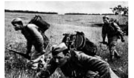
Доставка горячей пищи на передовую.

Чтобы научить другого, требуется больше ума, чем чтобы научиться самому.