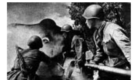
Переход на новую огневую позицию.