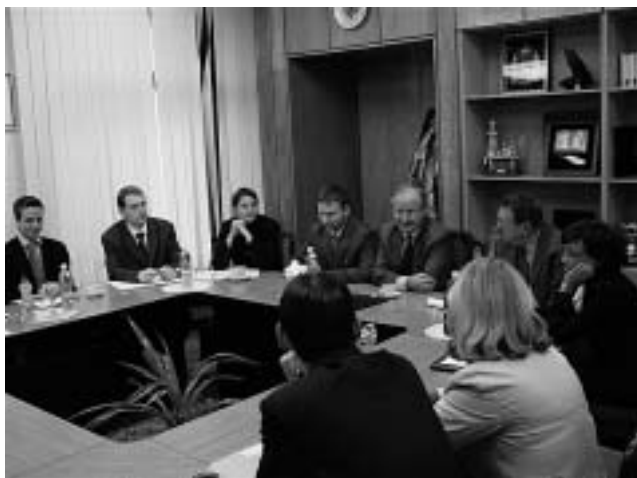
Визит французской делегации.