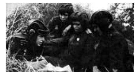
Танкисты получают боевую задачу.